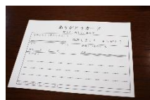
社員間のコミュニケーションを 高める「ありがとうカード」を導入

「社員が一番の財産と考え健康経営に取り組んできた」 様々な働き方改革の取り組みにより、「健康経営優良法人」に 2017年から5年連続で認定。2021年には優良な上位500 法人に対して新しく付与されることになった「ブライツ500」 の認定も受けている。